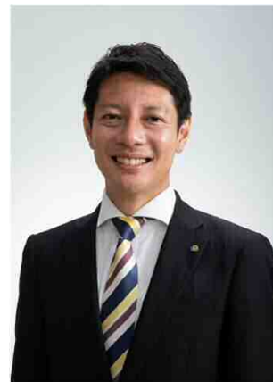
磐田市長 草地 博昭