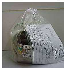
<専用ポットと容器>

アレルギー対応専用の場所で調理し、一人ひとり専用のポットや容器に入れて提供します。