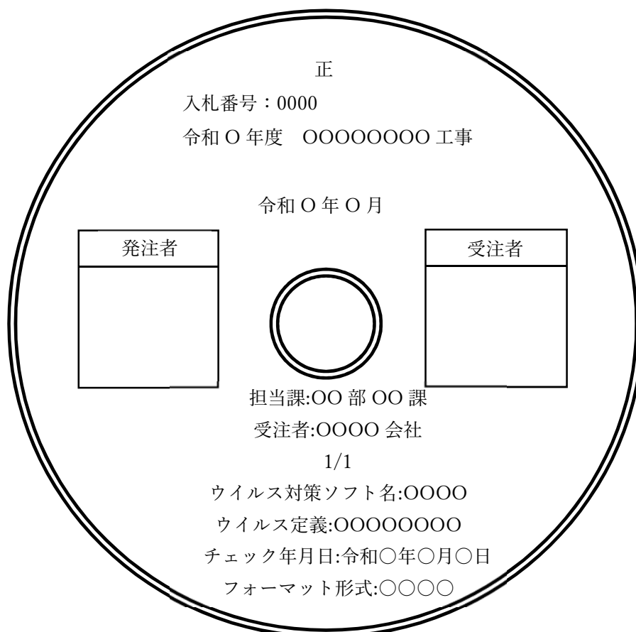
電子媒体のラベル面の記載例

電子媒体のラベル面は、下記の記載例を参考に「正・副」、「入札番号」、「工事名」、「電子媒体作成年月」、「担当課名」、「受注者名」、「何枚目/全体枚数」、「ウイルス対策ソフト名」、「ウイルスチェック年月日」、「フォーマット形式」、「発注者署名欄」、「受注者署名欄」等を直接印刷するか書込みにより明記して、シール等の貼付けは行わないこと。また、署名欄はウイルスチェックをした者が油性フェルトペン等で直接署名し、押印はしないこと。