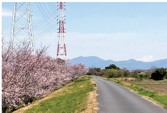
◀太田川堤防沿いの桜並木(3月末)山並みと川と桜の雄大な景色です。