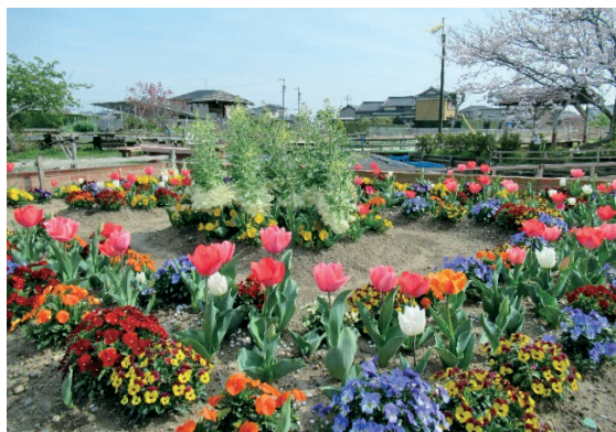
◀水辺の里の花壇(3月末)ポラントイアの方々の手入れのおかげで満開に咲きそろいました。

南御厨地域づくり協議会では、3月に新旧合同の理事会が行われ、引継ぎのための打ち合わせが行われました。本年度新役員は4月23日の総会で承認後、本格的に活動を始めます。