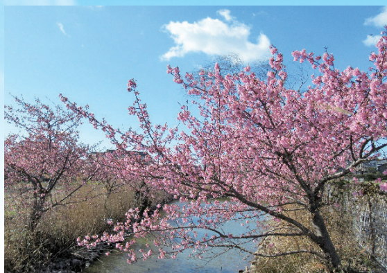
◀水辺の里の河津桜(3月初)まだ寒の戻りの冷たい風の中でしっかりと花開きました。

春の訪れとともに今年も南御厨地区が花で包まれました。新和口橋から太田川の土手にかけて、さわやかな風の吹くウォーキングコースになっています。