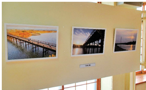
◀在りし日の旧和口橋

交流センターの2階洋室で写真展を開催しました。江戸時代からの太田川治水の様子や新和口橋の建設過程などが展示されました。