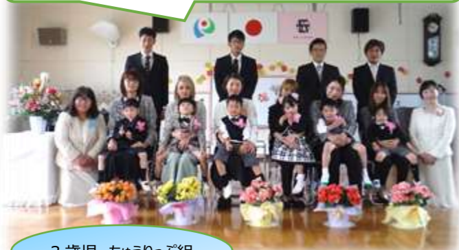
3歳児 ちゅうりっぷ組

4月11日入園式 かわいい子どもたちが入園しました。お友達や先生と元気いっぱい遊ぼうね！