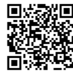
長野小 HP は上記 QR コードより