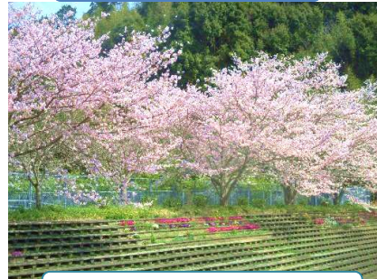
3/28 桜(東交流センター)