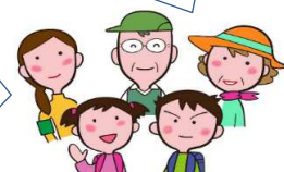
現サポートメンバーの声

いつも学校のことを気に留めていたのが、思い切って参加をして、校内のこと、子供たちとの触れ合い、他の参加者との触れ合いもでき、大変良い経験となっている。