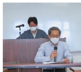
文教活動報告金原部会長