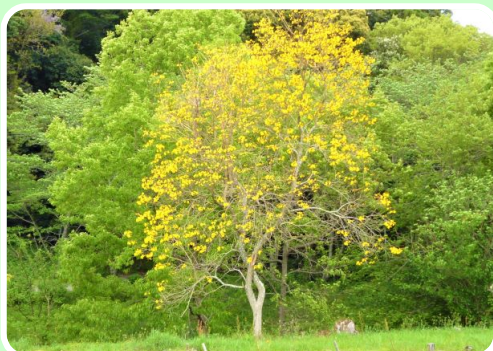
西貝塚明ヶ島線横(左の写真)と水車の里南(右の写真)のイペーの木