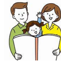
家族そろって読書タイムを