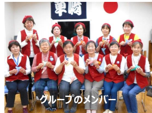
グループのメンバー

「オカリナグループ おたまっちょ」は、2004年11月に発足しました。オカリナの奏でる音色に魅了された福祉委員経験者の方が、中心になりオカリナの演奏方法を一から学ぶ事から始めました。サロン参加者のみなさんに、今まで以上に楽しんでいただきたいという考えに共感して、他の地域の方もグループに参加して活動しています。