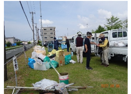
ゴミは南交流センターグラウンドに集められました

年2回美化活動を行っていますが、毎回たくさんのゴミが集められます。一人一人がゴミを捨てない、家に持ち帰るよう心がけましょう。