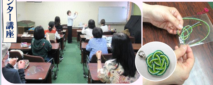
日本の伝統文化「水引」でアクセサリ-を作成 マスクチャームの素材と完成品