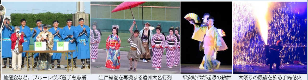
抽選会など、ブルーレヴズ選手も応援 江戸絵巻を再現する遠州大名行列 平安時代が起源の新舞 大祭りの最後を飾る手筒花火

5月28日(土)、コロナ禍で開催を控えていた「第20回いわた大祭り遠州大名行列・舞車」が3年ぶりに開催され、延べ約8,000人が見学に訪れました。例年、開催会場は見付宿場通りですが、今回は感染対策のため、来場者の管理ができるようにと磐田城山球場を会場にしました。当球場はかつて徳川家康が築城予定だった「幻の城」の地でもあり、来年放映の大河ドラマ「どうする家康」につながる話題づくりにもなりました。