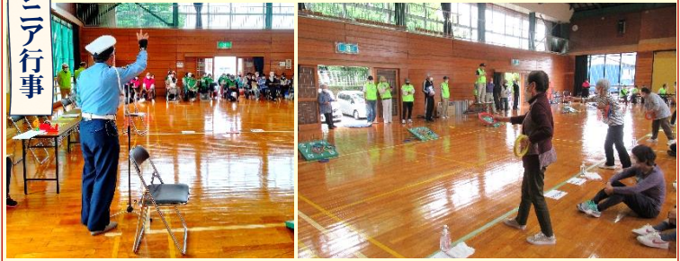
朝礼で署指導員の交通安全講話も 市の本大会出場に向け12チームが参加