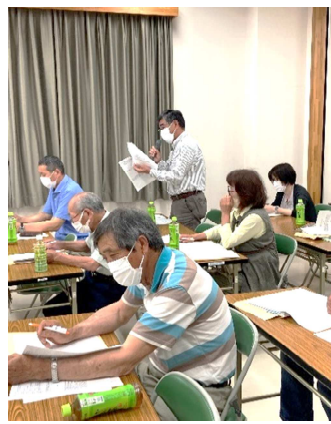
アンケート検討委員会

現在、皆さんの手元でアンケートに記入していただいておりますが、8月上旬には概ね回収作業を終え、豊岡中学3年生の協力でデータ入力・集計作業をお願いすることになりました。