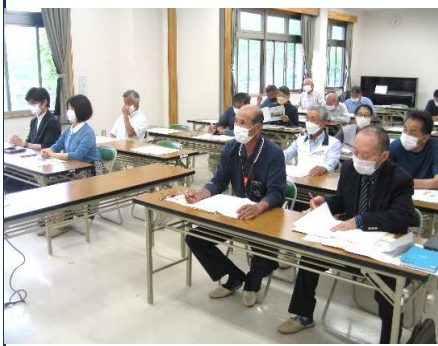
東地区環境保全協議会総会