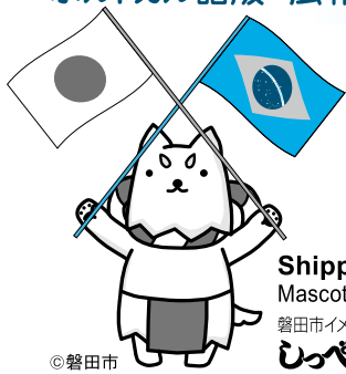
Shippei Mascote da cidade 磐田市イメージキャラクター しっぺい