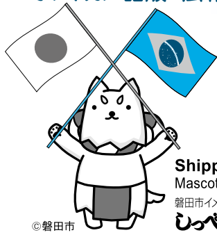
Shippei Mascote da cidade 磐田市イメージキャラクター しっぺい