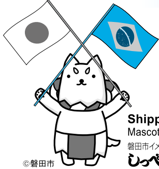
Shippei Mascote da cidade 磐田市イメージキャラクター しっぺい