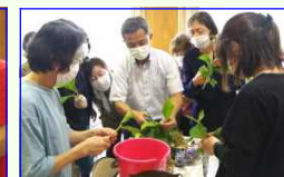
＜挿し穂の剪定見本＞＜指導を受けながら挿し穂作り＞＜挿し木＞