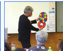
＜あざやかな手さばきに目を見張る＞