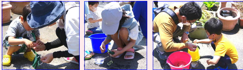
〈写真上:めだかの卵採り〉