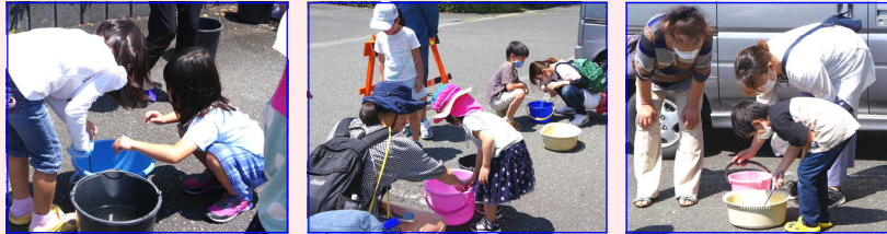
〈写真上:めだかすくい〉