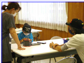
＜時を忘れて、親子で楽しんでいました＞