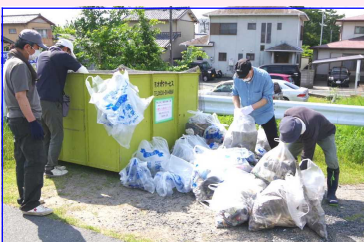
＜ 不燃物・可燃物回収に精を出す参加者＞