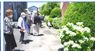
＜センター周りのあざやかな紫陽花に目を見張る＞