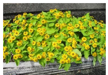
メランポジューム ジャックポット