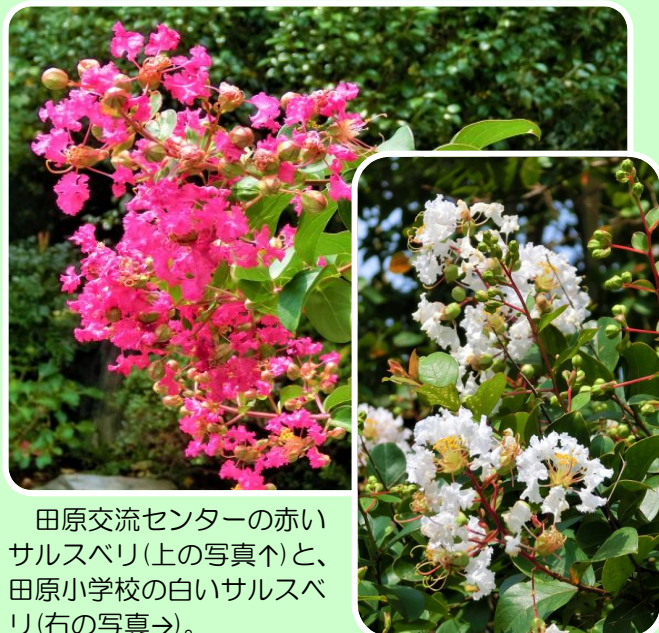
田原交流センターの赤いサルスベリ(上の写真↑)と、田原小学校の白いサルスベリ(右の写真→)。

まだまだ暑いこの時期、交流センターや小学校ではサルスベリが咲き誇っています。サルスベリは、7月下旬から10月上旬まで花を楽しむことができます。