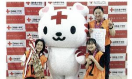
一般の部 総合優勝 浜松医療学院 Ladies