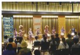
イニセア方によるワークショップ