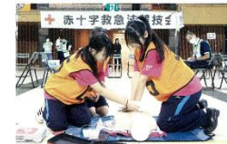
心肺蘇生競技を行う高校生