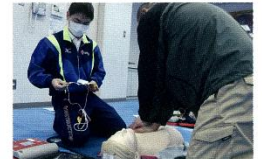
胸骨圧迫やAEDの使い方、けがの手当などの 知識と技術を学びます。