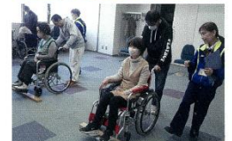
誰もが迎える高齢期を健やかに生きるために 必要な、健康増進の知識や高齢者の支援・自 立に向けた生活の仕方や工夫を学びます。