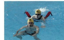
水の事故からいのちを守るため、泳ぎの基本と 自己保全、事故防止、溺れた人の救助、応急手 当の方法などの知識と技術を学びます。