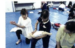
子どもを大切に育てるために、乳幼児期に起こりやす い事故の予防とその手当、かかりやすい病気（発熱・ けいれん等）の手当に関する知識と技術を学びます。