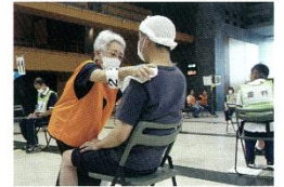
三角市によるきずの手当を行う専任団員

静岡県支部は、毎年救急法競技会を開催しています。 本競技会は、日常生活における安全意識を高め、事故や災害 時にお互い助け合いながら活動するための知識と技術を向上 させることを目的とするとともに、赤十字活動への理解を深 め、その活動の担い手となるボランティア相互の連携を強化 する場としています。 第13回目となった今年度は、選手やスタッフなど400名が参 加し、60チームが救急法の技術を競い合いました。