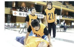
救命応急手当をする専門学生