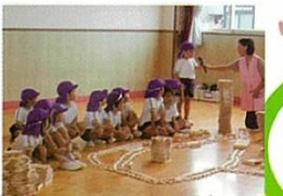
間伐材の積み木で木育

緑の羽根やチラシ等の作成と配布、森林や緑化に関する情報発信、緑の募金の管理等により、緑の募金運動を推進します。