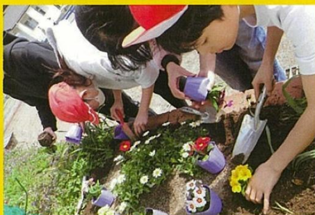
配布した資材を活用した緑化活動