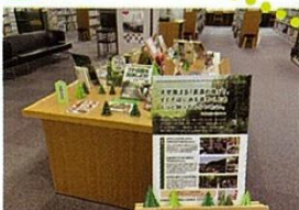
「図書館でグリーンキャンペーン」の実施

緑の羽根やチラシ等の作成と配布、森林や緑化に関する情報発信、緑の募金の管理等により、緑の募金運動を推進します。