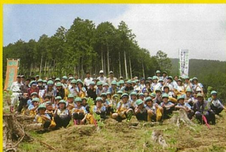
緑の少年団の植栽活動を助成