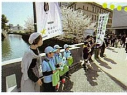
県内各地で募金活動

市民や森林ボランティアによる苗木の植林等を支援し、県民参加の森づくりを促進します。