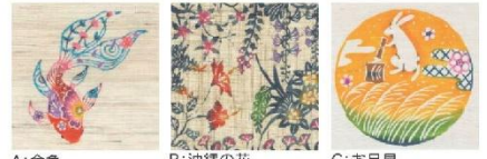
A:金魚 B:沖繩の花 C:お月見