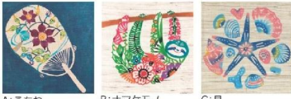
A:うちわ B:ナマケモノ C:貝