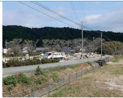
災害ごみ仮置き場①