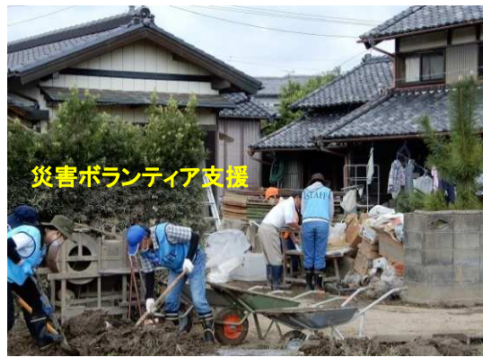
災害ボランティア支援