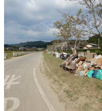
災害ごみ仮置き場②