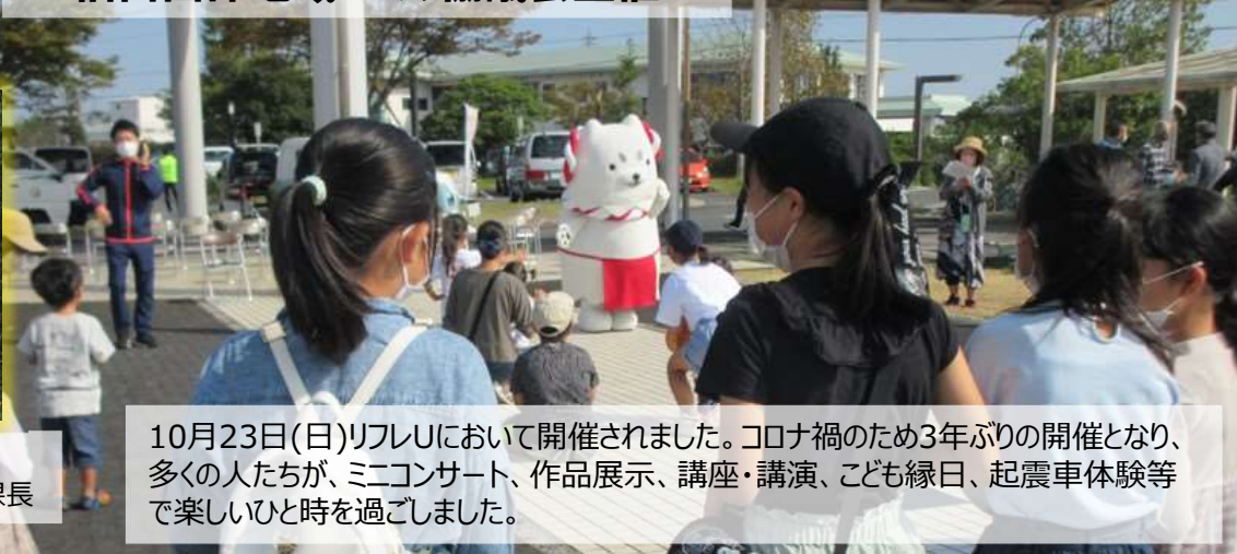
10月23日(日)リフレUにおいて開催されました。コロナ禍のため3年ぶりの開催となり、 多くの人たちが、ミニコンサート、作品展示、講座・講演、こども縁日、起震車体験等 で楽しいひと時を過ごしました。