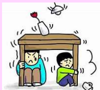
起震車による震度7の体験