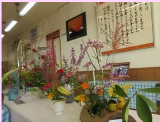
絵画・彫刻・写真・書・フラワーアレンジメント、 手芸品等多彩な展示品