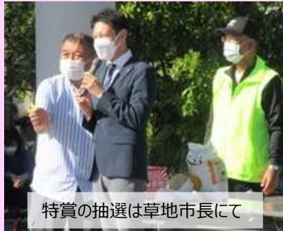
特賞の抽選は草地市長にて