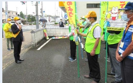
一斉街頭キャンペーンでの市長挨拶

その後1時間ほど、磐田市自治会連合会長、交通安全協会磐田地区支部長、見付地区の自治会長と交通安全委員の皆さんで、交通安全運動ののぼり旗を持って、通行する車両や自転車、歩行者に街頭交通指導を実施しました。