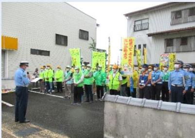
警察署長から交通安全の注意喚起