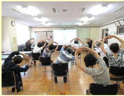
体をほぐして腰・膝・肩の痛みを緩和