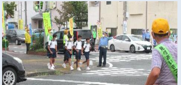
見付地区の無事故を願う交通指導(馬場町交差点で)