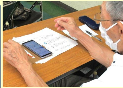
スマホ初心者向け講座第1回目 16名が参加