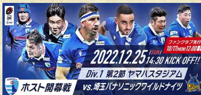
ホスト開幕戦は12月25日(日)

私たちの地域活性化のためにも、サッカーのジュビロ磐田と同様、静岡ブルーレヴズを皆で応援しましょう。