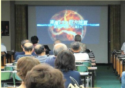
巨大地震発生を警告する NHK 特番の視聴

この研修会では、現在発生が危惧されている南海トラフ巨大地震の情報をNHKが特集した番組「南海トラフ巨大地震、迫りくる“Xデー”に備えろ」のDVD視聴や万一の際の救命医療機器AED(自動体外式除細動器)の使い方の練習、スマホで緊急情報の通知やハザードマップの確認・避難トレーニングなどができる静岡県総合防災アプリの紹介など、約3時間にわたる研修で地域の防災リーダーの皆さんの防災知識向上をはかりました。