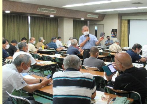
スマホで県防災アプリの機能を確認