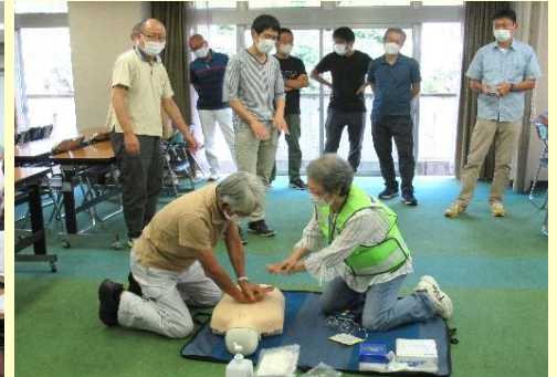
肋骨圧迫とAED使用で心肺蘇生の研修