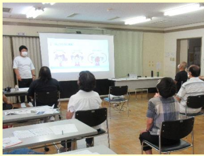
体の痛みに関する理学療法士の健康講座