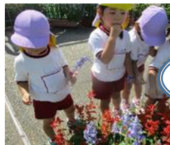
甘い味のジュースだよ♡