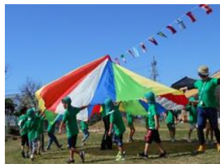
5歳年長児 ひがしっこまつりでバルーンをしたよ！