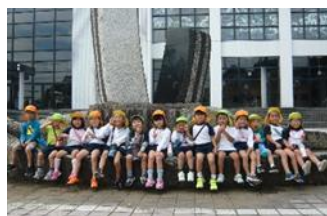
なぎの木会館へお散歩