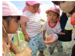
1歳未満児 先生が捕まえた虫に興味津々！「なにがいるの？」