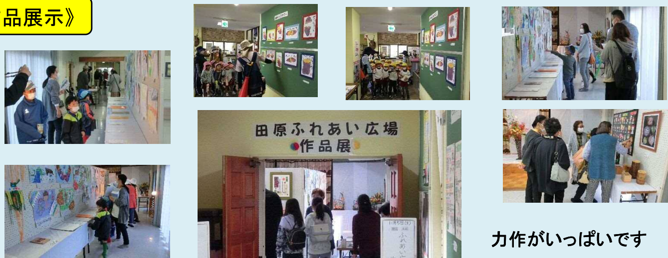
力作がいっぱいです