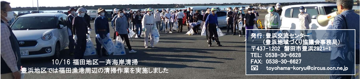
10/16 福田地区一斉海岸清掃 豊浜地区では福田漁港周辺の清掃作業を実施しました

発行：豊浜交流センター (豊浜地域づくり協議会事務局) 〒437-1202 磐田市豊浜2921-1 TEL: 0538-30-6628 FAX: 0538-30-6627 ✉ toyohama-koryu@circus.ocn.ne.jp