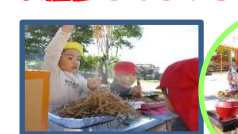
焼きそば、たこやき屋さん