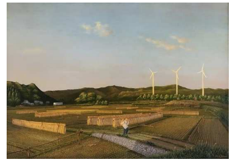
「田園風景」大隅喜一 様