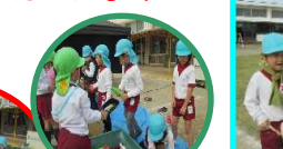
くじびき、魚つり屋さん