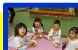
「たこやき!おいしい!」