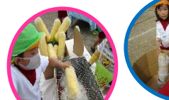
焼きトウモロコシ、わたがし屋さん

他にも、各学年ごとに様々なお店やさんがあり、友達とのやりとりを楽しみながら遊んでいます。