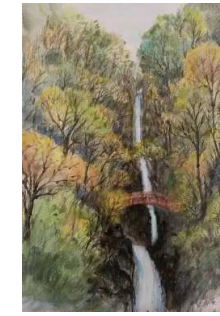
「秋色五宝の滝」 仲川勝彦 様