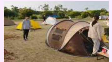
〈米の袋に水を入れて〉〈テント・車中泊の朝〉