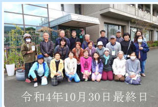
令和4年10月30日最終日

健康づくりの一環として、みんなと一緒に楽しく進めていくことが健康づくりに繋がることだと思います。