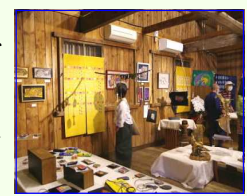
ドルチェ倉庫(一部)