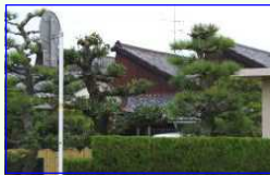
②織布工場ののこぎり屋根遠望