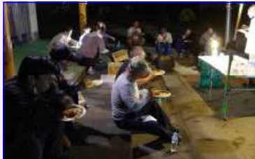
〈皿に盛り付ける〉 〈みんなでカレーを〉