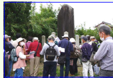
③別荘の祖・寺田市十の碑