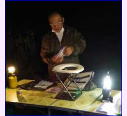
〈ミーティングで意見交換・携帯トイレの大切さを〉