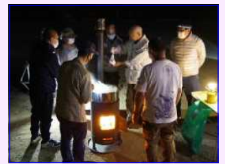
〈袋の空気を抜いて〉 〈湯煎を見守って〉