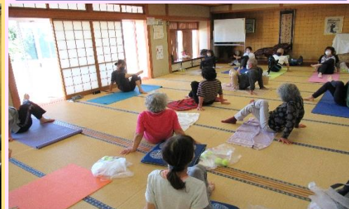
ボール等を使って血流を良くし体を温めるストレッチ