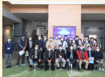
【見付地区の防災リーダーの皆さん】