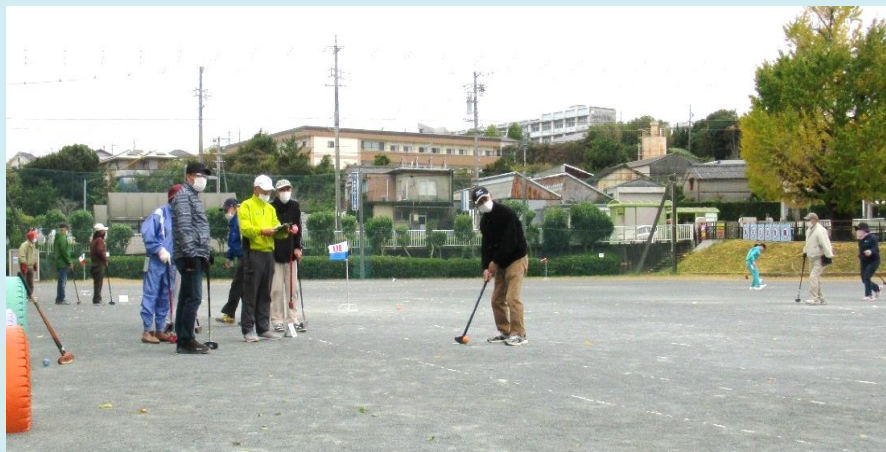
時々小雨が降る中でしたが、みなさんご健闘いただきありがとうございました

11月20日（日）に磐田北小運動場で『磐田市5地区選抜グラウンドゴルフ大会・見付地区予選会』を開催しました。当日は、3名1組の19チーム（57名）が参加、12ホール2ラウンドで順位を競い、3月11日（土）にスポーツ交流の里ゆめりあで開催する本大会に出場する上位8チームが決まりました。本大会では見付地区の代表選手として、ぜひがんばってください。