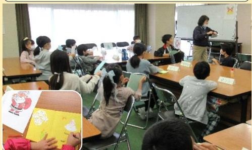
小学生の皆さんが英語でクリスマスカードを作成