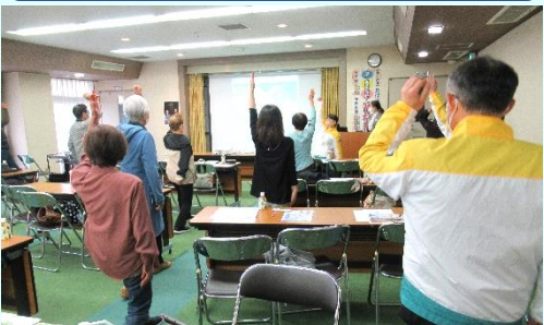
フレイル（虚弱）の予防法→食事・睡眠・運動・交流