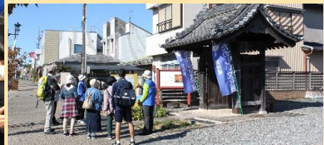
ふれあいガイドさんの案内による見付宿散策ツアー