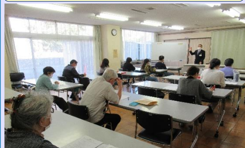
講師（市民相談センター）が皆さんの不安にお答え