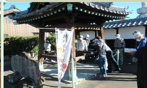
来年の大河ドラマ主演・家康が見付に残した史跡を散策