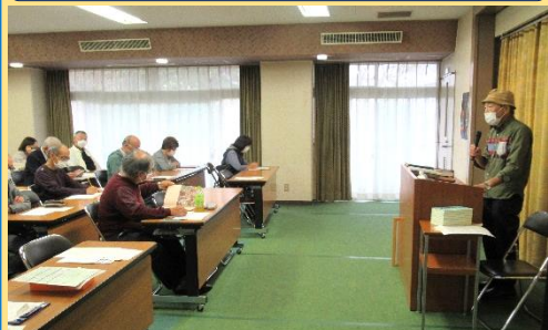
しっぺい太郎伝説の知られざる真実の歴史の講話