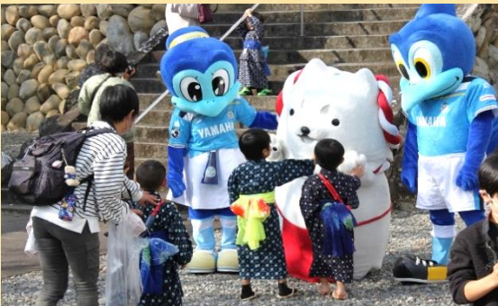
旧見付学校でのしっぺい君たちと子供かすり着物写真撮影会