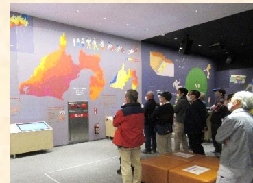
【南海トラフ巨大地震の震度分布図】