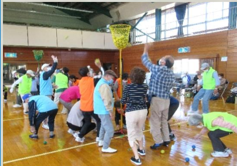
見付地区のシニア 168名の皆さんが元気に参加