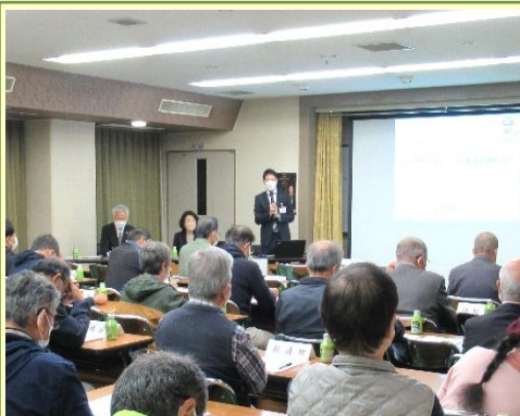
「市民一人一人が安心できる環境をつくり風通しの良い市政に行きたい」と語る草地市長