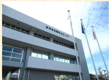
【静岡県地震防災センター】

11月9日（水）に見付地区自治会の防災リーダーなど26名が、静岡市葵区静岡県地震防災センターを視察しました。この研修では、現在危惧されている南海トラフ巨大地震から身を守るための講習や各種防災用品の見学や起震装置による巨大地震の揺れの体感などを通し、参加者の防災意識の向上をはかりました。