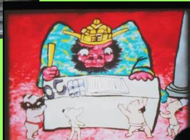
じごくのそうべい

9本の16ミリフィルムの上映を行いました。笑いあり、涙あり、懐かしさあり。子供たちの目には、新鮮に映った事と思います。ディズニー作品が一番の人気でした。古いフィルムは、貴重なものばかりです。後世に長く継承し、また機会があれば、上映したいと思います。