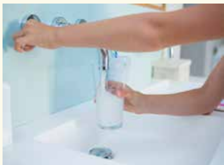
※今回の改定では、水道料金変更はありません

※改定率とは、使用料収入全体で13・9%の増収を目標としたもので一律に13・9%の値上げではありません