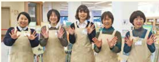
▲にこっこ常駐の保健師、保育士の皆さん