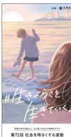
▲啓発リーフレット

市内では、7月の強化月間に保護司会・更生保護女性会を中心に啓発活動などが行われます。