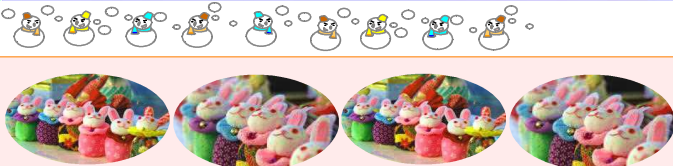
〈福田南手芸クラブ員製作〉