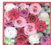
BOX & 花の種類は イメージです

ボックスフラワーは色鮮やかな花々が 敷き詰められているボックスです。 見た目は普通のボックスなのに、 蓋を開けるとびっくり! たくさんのお花が顔を覗かせます。 プレゼントに最適♪