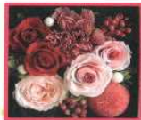
BOX & 花の種類は イメージです

とき: 3月7日(火) 時間: 10:00 ~ 11:30 頃 対象: 大人 定員: 10人 費用: 1,500円 受講料: 100円 材料費: 1,400円 持ち物: 花はさみ、持ち帰り用袋