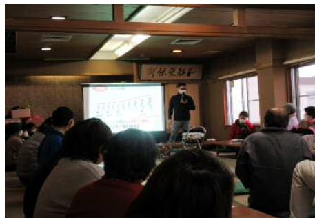
准教授によるロコモに関する講座