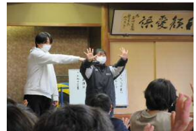
学生による運動指導