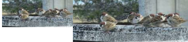
玄関前のすずめの群れ