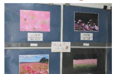
アサギマダラ ユズセキ 新川 由子