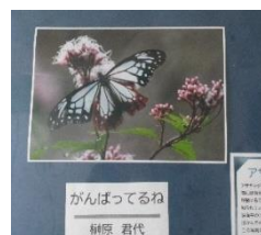
がんばってるね 新原 君代