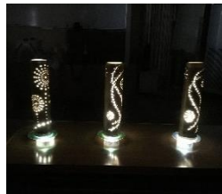
素敵に仕上がりました

2回目の1月21日には、先生が用意して下さった型紙を竹に糊付けし、竹専用のドリルを使って、型紙の模様に合わせて穴を開けていきました。サイズの違うドリルをいくつも使い、模様を形作っていきます。