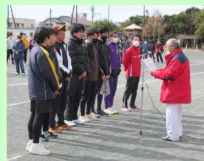
自治会の部 優勝 金洗Aチーム

自治会の部は、金洗Aが第1区から終始トップを走り55分12秒で1位（総合優勝）、駒場が2位、飛平松が3位の成績でした。また、一般の部は、よいよい委員会が1位となりました。