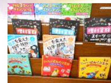
読んでみたい本の購入