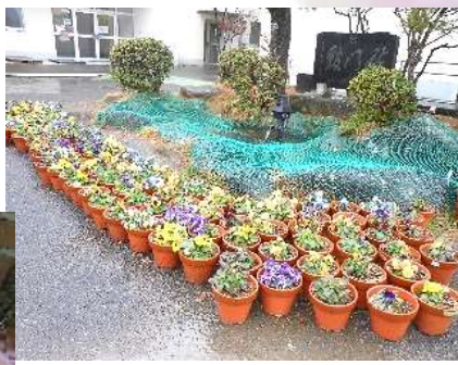
色とりどりの花を育て、卒業生を見送ります