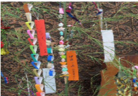
ひよこ制作の 七夕飾りです

3月から準備を始めて、栽培をしていた「フジバカマ」 につぼみらしきものが出てきました。秋までに咲けば 「ひょっとして。。」「アサギマダラ」が迷って 飛んでくるかもしれません。撮影会か??