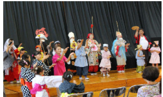
※前回の文化祭「七福神」です