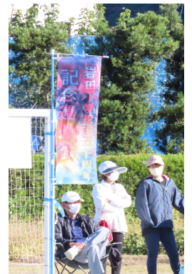
右：地区長手作りののぼり 旗（150周年記念）