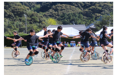
一輪車の団体演技も頑張りました。

リレーは1～3年生と4～6年生の2レースがおこなわれました。みんな次のランナーにバトンを引き継ぐべく、一生懸命な走りを披露しました。