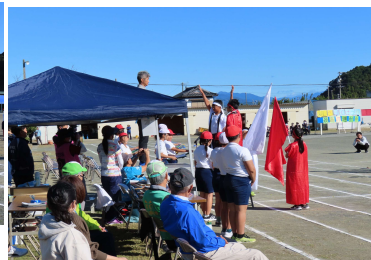
左：開会式の様子と 選手宣誓