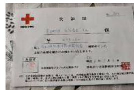
上の写真は、「梅干し募金」のもので、豊岡地区に75,000円、能登半島地震に29,626円を寄付しました。