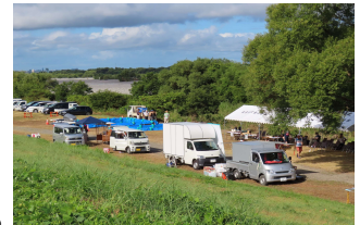
左：受付のようす 中：開会式と川についての勉強会 右：今回初めてキッチンカーも参加しました