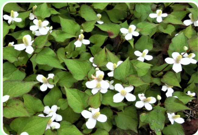
↑ 群生して咲くドクダミ。花の白色が目立ちます。

初夏から夏にかけて田原地区の民家の庭先、空き地や道端などでは、群生するドクダミが白い花を咲かせます。ドクダミは、香りがきついことや繁殖力が強いはびこりやすいことなどから、雑草として嫌われがちです。また、名前から「毒」を連想する人もいますが、ドクダミは有毒植物ではありません。白い花が可愛らしいため、鑑賞用に栽培されることもあります。