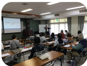
5月開催 LINEとインスタグラム入門の講座の様子です