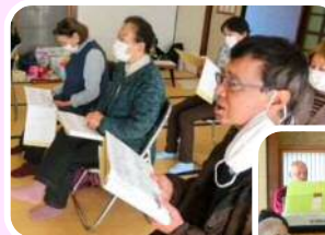
楽団アイニスタの皆さん

12月10日(日)、3世代ぷらっとのクリスマス会が開かれました。今回は、演奏活動で活躍中の楽団アイニスタをお招きして合唱会が行われ、参加者の皆さんが大声で歌って盛り上がりました。他にもお菓子のくじ引きやゲームが行われ、参加者の皆さんは肩ひじ張らないのんびりとした雰囲気を楽しんだ時間を過ごしました。