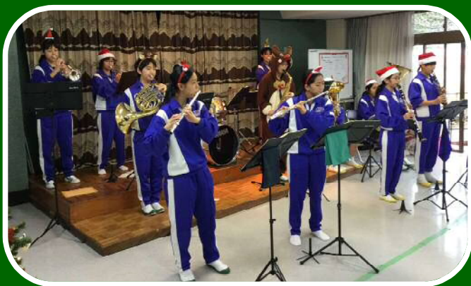
音楽倶楽部こまやか