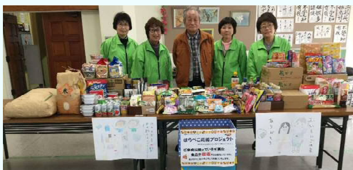
ご協力ありがとうございました

11月14日（火）～12月10日（日）の日程で「第6回 はらぺこ応援プロジェクト」を開催しました。