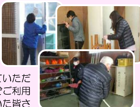
↑ 体育館の掃除の様子。器具庫の中もきれいになりました。

普段は手の届かない場所が次々ときれいになっていく様子を見ながら、「これで気持ちよく利用していただける」と感じました。今後もどうぞご利用ください。大掃除にご協力いただいた皆さん、本当にありがとうございました。