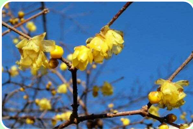
↑ 田原交流センターの庭に咲くロウバイの花。