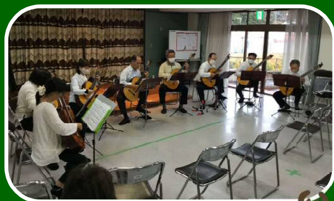
田原ギタークラブ