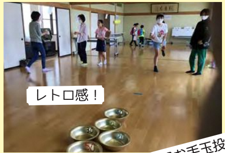
洗面器お手玉投げ