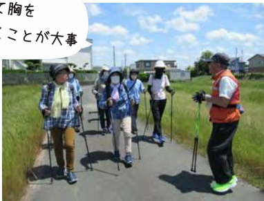
ノルディックウォーク体験講座