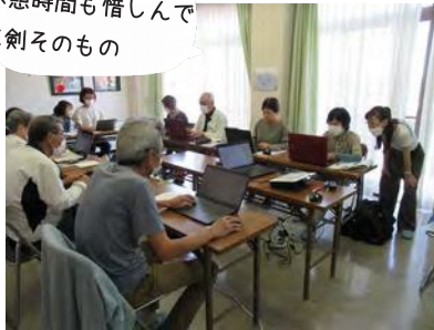
パソコン講座 (Word 編)