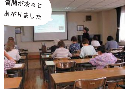
シニアのためのスマホ教室