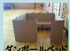
ダンボールベッド