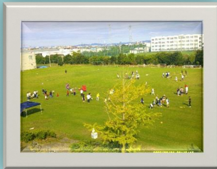
地上30mからの風景(はしご車より)