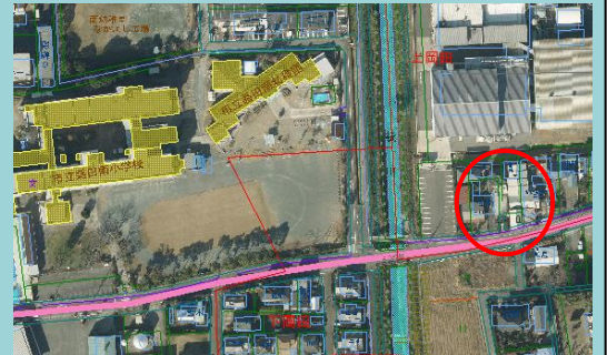
碑は南小の東にあります