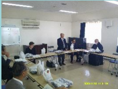
交流センターで懇談