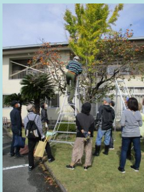
渋柿の木 講師の手本