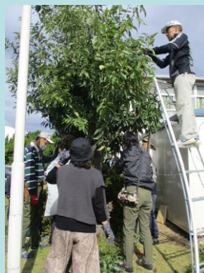
檜の木 受講者の実践