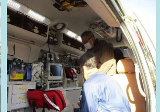
救急車の中も見学。色々な機器に参加の皆さんも興味津々。