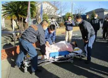
救急車にも乗ってみました。担架、ストレッチャーに乗って救急車へ。乗り心地は?皆さんもどこか心配そうな表情に。

実際に通報(訓練)してみました!患者の状況は?意識・呼吸はありますか?問いかけに反応はありますか?心臓マッサージはできますか?など聞かれることはたくさん。