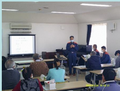
救急搬送件数や傷病者の状況、指令センターの内容などの講義

1月24日(水)地区社協役員は活動の中で起こりうる傷病者の発生に備え、消防119番への通報訓練(研修)を行いました。当日は役員20人超の参加で、磐田市消防本部警防課救急企画室職員の指導を受けながら、講義や実技などを行いました。 体験しておくことは重要です!