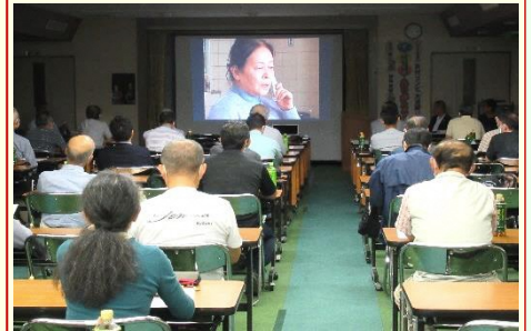
地域の防犯・交通安全のため年に4回開催 今回は振込めサギ注意喚起のDVD視聴も