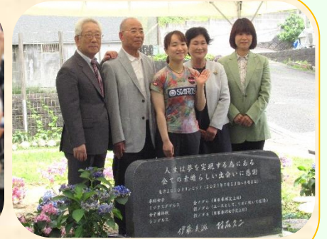
記念石碑のお披露目(磐田市見付にて)