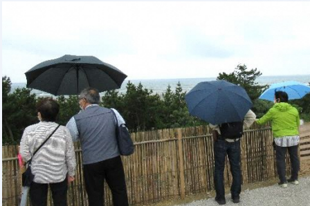
応募者 31 名が福田町防潮堤などを見学