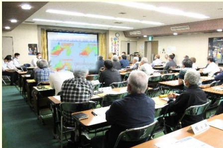
磐田市危機管理課による地域防災研修会 見付地区の自治会役員など 50 名が参加