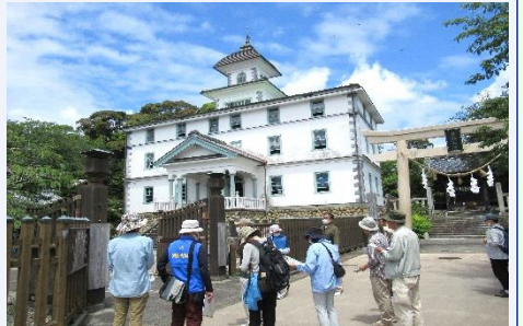
明治8年竣工の旧見付学校(国指定史跡)