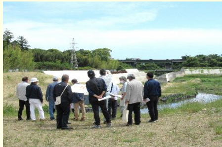
地域の役員が地元の治水対策の設備を視察 (写真は現在整備中の元宮町・柴田山調整池)