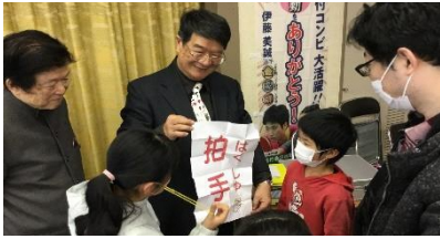
講師のマジックに参加した親子もビックリ