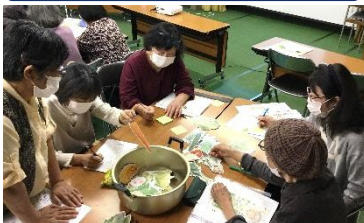
健康を保つ野菜パワーで生活習慣病予防を