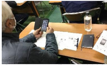
誰でもできるスマホの使いこなし方を伝授