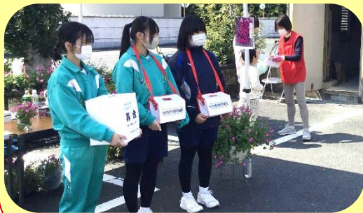
懸命の呼びかけで支援金を募る城山中生徒の皆さん