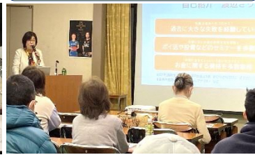
皆さんの関心が集まる資産形成の情報