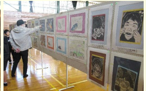
児童作品展示にも多くの家族連れが見学に