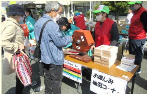
850世帯が訪れたお楽しみ抽選会

3月16日(土)、見付交流センターで見付地区地域づくり協議会主催の第8回見付地区交流センターまつりを開催し、好天に恵まれた当日は見付地区の850世帯・約2,000人を超える皆さんが訪れ、にぎわいを見せました。今回は、作品展示・芸能発表・酒井太鼓演奏など50団体の皆さんが参加、日頃の活動の成果を披露し、地区社会福祉協議会の皆さんの竹とんぼ作りによる子供たちとのふれあいや新鮮野菜、干し芋販売なども実施し人気を集めました。また、ボランティアとして、まつりの運営をお手伝い頂いた城山中学校の生徒さんによる能登半島地震支援の呼びかけでたくさんの募金が集まりました。開催に際し、参加されたサークル・福祉団体・学校・保育園の皆さん、ご支援頂いた役員・自治会・体育委員会・ボランティアの皆さん、誠にありがとうございました。