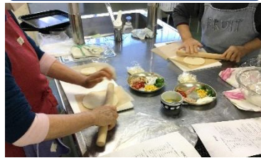
トマト・野菜ピザと和菓子作りに挑戦