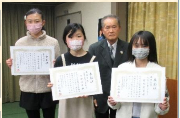
見付地区北小学校区の最優秀で表彰された皆さん = 2月16日見付交流センターにて