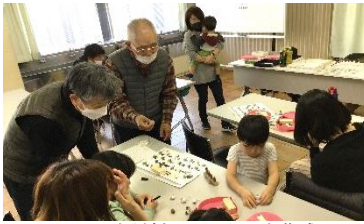
どんぐりを材料にコマなどを作成