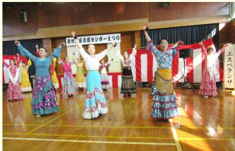
芸能発表のトリを飾るフラメンコのダンス