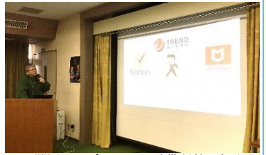
日頃聞けないパソコンのネット詐欺対策も紹介